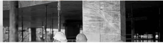
Ils nous font confiance