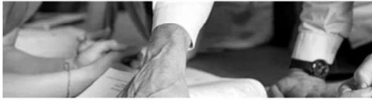
Qui sommes nous